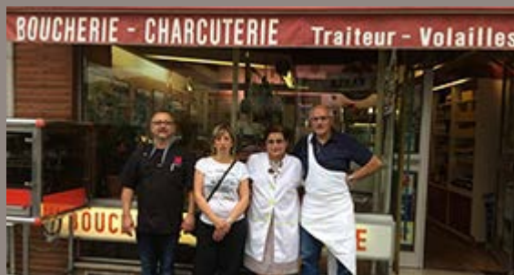
Reprise de la boucherie Verdès à Graulhet

En reprenant la célèbre boucherie Verdès en centre-ville, la Bouch'Rit ouvrira ainsi son deuxième point de vente à Graulhet, dès le début du mois d'août.