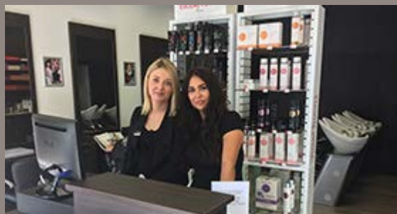
Nouveau salon de coiffure - Graulhet

La marque Bruno Flaujac s'installe rue Jean Jaurès au centre-ville de Graulhet et compte aujourd'hui plus de 50 salons de coiffure dans le sud-ouest