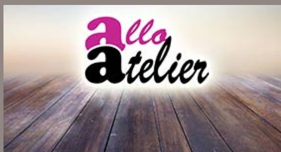
Allo Atelier ouvre à Briatexte

Installé depuis quelques semaines au Faubourg du Pont, Allo Atelier est spécialisé dans la conception, la création et la restauration en cristallerie, trophées, covering et signalétique.