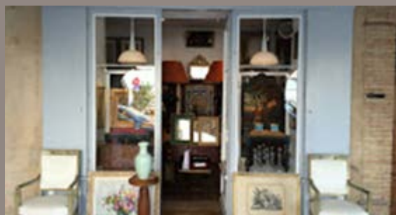
Candau Antiquités - Gaillac

Antiquaire généraliste, Alexis Candau s'implante dans un deuxième local en centre-ville de Gaillac place du Griffoul, et propose des objets raffinés et objets d'art de toute époque. Ouvert du mardi au dimanche midi et sur RDV / Tél : 06 18 28 13 90.